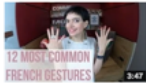
12 common French gestures de Comme une Française 52 628 vues • il y a 8 mois