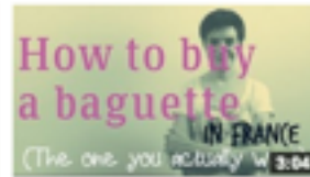
How to buy the perfect baguette in France de Comme une Française 6 310 vues • il y a 1 an