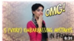
5 (very) embarrassing mistakes in French 59 055 vues • il y a 1 an