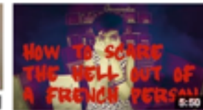
Cultural differences: How to scare a French person 22 620 vues • il y a 10 mois