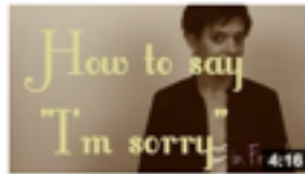
How to say you're sorry in French de Comme une Française 8 295 vues • il y a 1 an