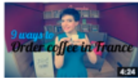
How to order coffee in France de Comme une Française 22 191 vues • il y a 10 mois