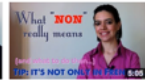
What "non" really means de Comme une Française 6 468 vues • il y a 1 an