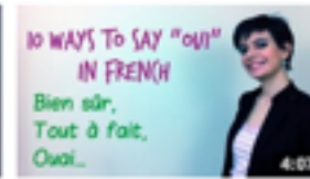
yes in French de Comme une Française 8 931 vues • il y a 1 an