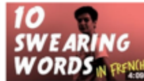
10 swearing words in French 45 978 vues • il y a 1 an