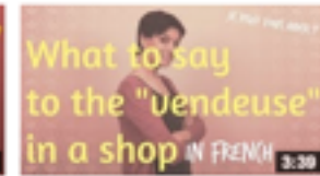
What to say to the vendeuse in a shop in France de Comme une Française 5 731 vues • il y a 11 mois

12 000 subscribers - 770 000 Youtube views Since 2012