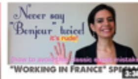
Never say "Bonjour" twice! 24 415 vues • il y a 1 an