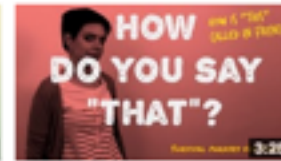
how do you say that de Comme une Française 6 158 vues • il y a 1 an