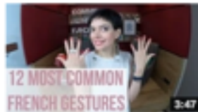
12 common French gestures 52 628 vues • il y a 8 mois